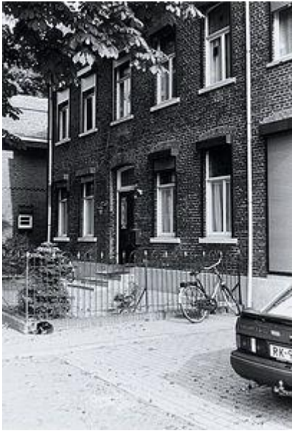
Aan het spoor

Het pas gebouwde station (1882) aan de nieuwe spoorlijn Venlo-Nijmegen was dé ideale plek voor bedrijvigheid. De stoomtrein was namelijk in die tijd het vervoermiddel van de toekomst. Bedrijven of fabrieken konden hun producten per stoomtrein laten vervoeren naar alle uithoeken van Nederland, ja zelfs naar het buitenland! Nu konden veel meer mensen hun producten kopen! In dit pand tegenover het spoor was in die tijd brouwerij Cambrinus gevestigd. Hier werd bier gebrouwen.