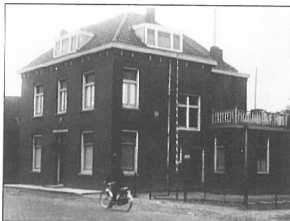
Jenaplan basisschool "De Peppels"

Waarschijnlijk werden er ook in deze leerlooierij nog geen machines gebruikt. Op een keer verdwenen deze kleine leerlooierijen uit Boxmeer, omdat er in andere plaatsen in Noord-Brabant grote stoomlederfabrieken gebouwd werden. Het bewerken van het leer werd in die fabrieken gedaan met behulp van stoommachines, dat was veel goedkoper dan met de hand.