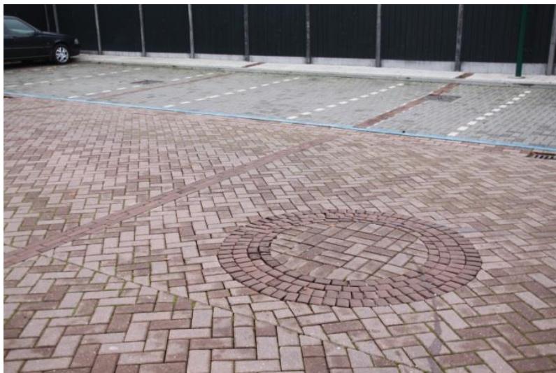
Jenaplan basisschool "De Peppels"