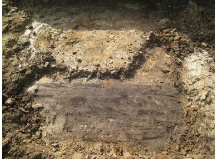
restant eiken kuip