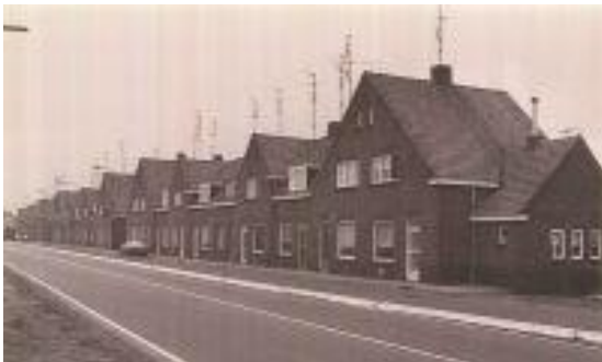
De huisjes in de vorige eeuw. Zie je de TV-antennes?