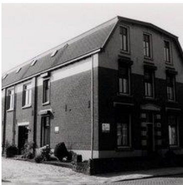
De sigarenfabriek Küppers-Bergmann.