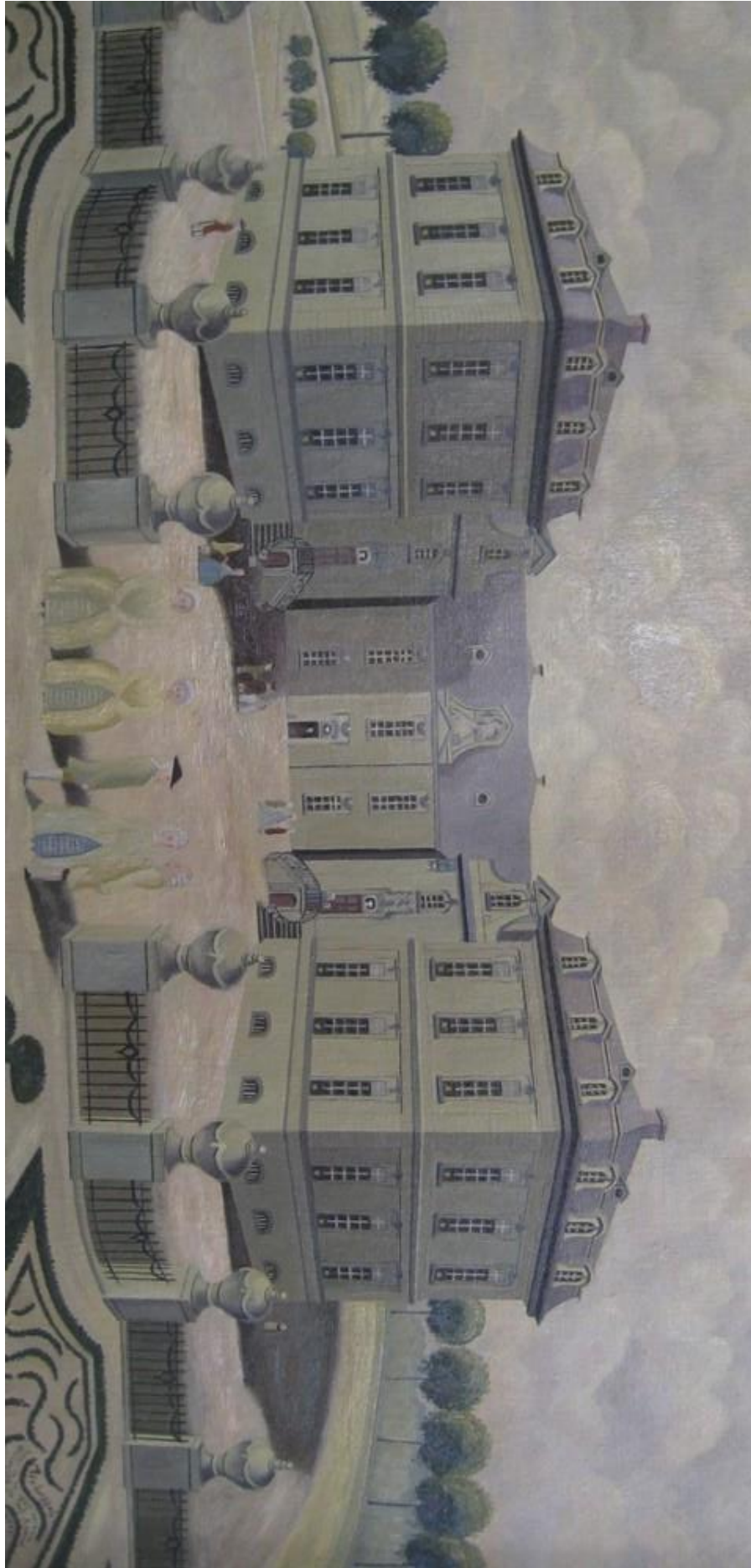
Jenaplan basisschool "De Peppels"

Ter plekke moeten de 3 stukken op de juiste manier tegen elkaar aan gelegd worden.