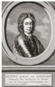
Menno van Coehoorn.