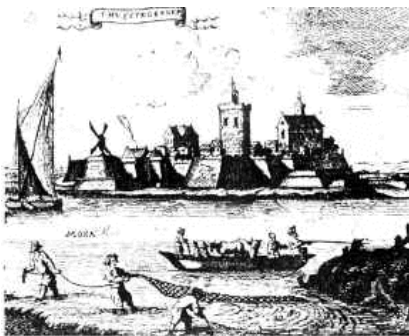
Het Genneper huys